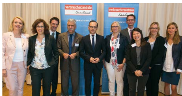
Fachtagung am 16. September 2016 mit Bundesminister Heiko Maas

ein Dialogforum mit Fachleuten aus der Hauptstadtregion in Berlin und eine Fachtagung mit Expert*innen aus dem gesamten Bundesgebiet in Saarbrücken, an der sich auch Bundesverbraucherschutzminister Heiko Maas mit einem Grußwort beteiligte. Fazit der Veranstaltungen: In den meisten Verträgen fehlt eine genaue Beschreibung der Leistungen und Kosten; oft existiert gar kein schriftlicher Vertrag.